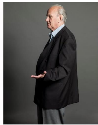
Frans de Gooijer / © 2014 Koos Breukel