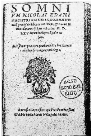
Titelblad van 'Somnium Nicolai Edani' in 1565 in Amersfoort uitgegeven door Jacob Buys en Adriaen Janssen en in 1993 vertaald door A.J. Brongers e.a.