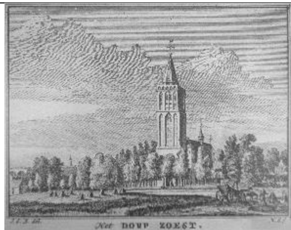
Het torenhaantje heeft alles zien gebeuren. Als hij eens kon spreken

Mochten we ooit te weten komen hoe de inwoners van Langbroek de kunsten van de betovering verbrekende pastoor ontdekt hebben dan zal het mij niet verbazen als de familie Schimmeldaar een rol in gespeeld heeft. In bovenstaand verhaal zitten hier en daar aannames, mocht u aanvullingen hebben hebben dan hoor ik dat graag, ook als u de veronderstellingen als een kaartenhuis in elkaar laat zakken heb ik daar geen moeite mee. Reacties naar de redactie of rechtstreeks naar Tonhartman01@cs.com