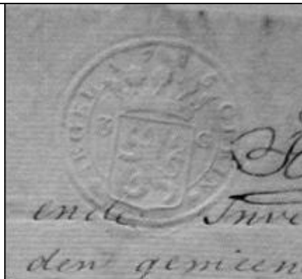
De waarde van het papierzegel is een maat voor de waarde van de totale boedel.

Boedelinventarissen zijn er al van vóór de 15e eeuw, maar de nadruk ligt toch op de 17e, 18e en 19e eeuw. De spreker inventariseerde ruim 300 van de bijna 1000 inventarissen uit de Krimpenerwaard uit de 17e en de 18e eeuw en probeerde daaruit een indruk te krijgen van de materiële cultuur.