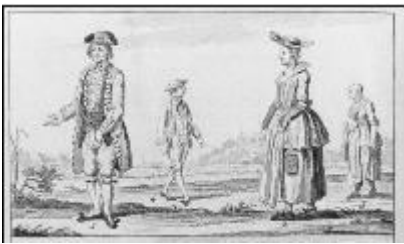
Prent uit een 'modeblad'

Met dank aan de spreker sloot de voorzitter deze avond af en keerden wij terug naar onze eigen inboedel