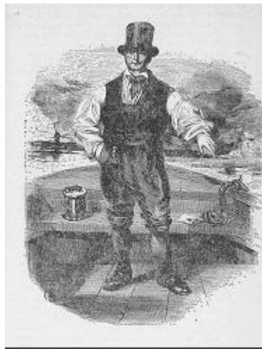
De schipper was te herkennen aan de hoge hoed

Zodra een trekschuitschipper een passagier ontwaarde op het schip van de beurtschipper was het oorlog. De schipper diende onmiddellijk een klacht in bij de burgemeester van de stad waarvan hij de vaarvergunning had ontvangen. Deze klachten werden genoteerd en zij vormden voor de spreker een belangrijke bron van onderzoek. Zij geven een boeiend beeld van de werksfeer uit die tijd. Een schipper was herkenbaar aan zijn hoge hoed, waaruit moest blijken dat hij een zelfstandige ondernemer was. De trekschuit bood een geriefelijke, comfortabele en veilige manier van reizen. De snelheid was constant zodat