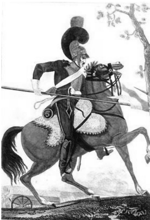
Soldaat van het vijfde regiment Bereden Lansiers

Ondersteuning van een weduwe door de oudste zoon vormde ook een grond van vrijstelling. Verder waren wezen (kostwinner), mannen met een gepensioneerde vader ouder dan 71 jaar, of mannen met een broer in dienst vrijgesteld.