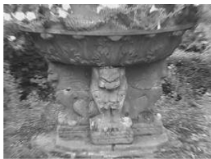
Tuin van Bollenburgh.