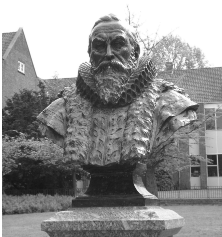
Buste van Johan van Oldenbarnevelt in Amersfoort.