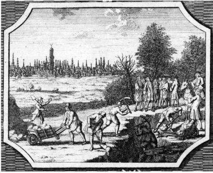
Aanleg kanaal Utrecht-Eem

In 1720 werd de Provinciale Utrechtsche Geotroyeerde Compagnie opgericht om investeringen te verkrijgen voor de aanleg van een kanaal tussen de Eem en de stad Utrecht zodat die laatste als zeehaven zou kunnen gaan fungeren. Er werden tekeningen gemaakt. En in de hele republiek investeerden mensen erin. Er is wel begonnen met graven, maar ook dit bleek windhandel te zijn.