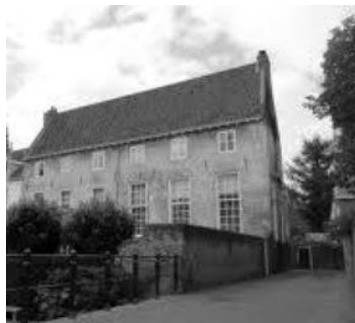
Huis Bollenburgh.

ondiep. Muurhuizen werden gebouwd op de plaats waar de eerste stadsmuur heeft bestaan. Deze werd na 1451 afgebroken, omdat in dat jaar de tweede muur klaar was. De grond die vrijkwam na afbraak van de oude muur, en na demping van de binnenste gracht werd benut om er huizen op te bouwen. Bijna alle muurhuizen staan met een brede voorgevel naar de straat gericht, omdat men weinig ruimte had om ver naar achteren door te bouwen. Bollenburgh is het breedste muurhuis van Amersfoort.