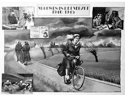
Schoolplaat uit 1981 door H. v.d. Wusten

Komend najaar viert de Nederlandse Genealogische Vereniging haar 70 e verjaardag en dat willen we niet ongemerkt voorbij laten gaan. Gekozen is voor een extra feestelijke publicatie voor alle leden in het najaar met de vrouw in de hoofdrol. Het thema is de vrouw in de genealogie. Dat kan een sterke of een bijzondere vrouw zijn.