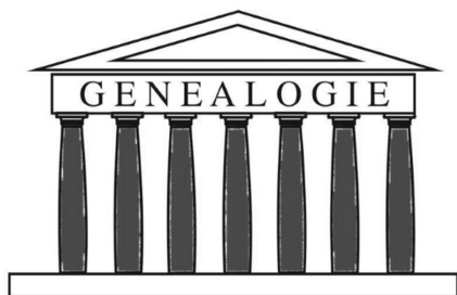
Illustratie: Rob van Drie, CBG.

Het voorzittersoverleg van genealogische verenigingen 1 heeft tijdens zijn vergadering van 21 maart 2015 de Zeven pijlers van het genealogisch onderzoek onderschreven. Het CBG formuleerde ze op initiatief van het voorzittersoverleg.