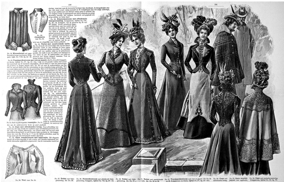
Voorbeeld van de damesmode rond 1886 (wespentailles). Afbeelding uit de Bazar: geïllustreerd tijdschrift voor modes en handwerken, jrg. 13, nr. 12 p. 180-181, via www.kb.nl.

nis kunnen zien. Dit geldt niet voor de oren want de ene persoon kan iets voorover kijken en de ander iets omhoog, dan verandert de stand van de oren.