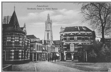
Utrechtse Straat met Politie Bureau.