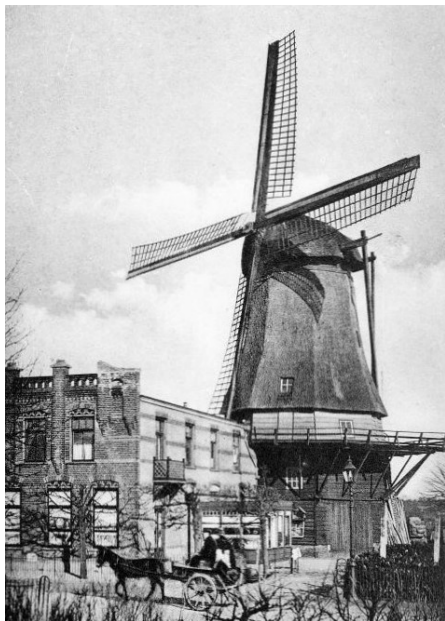
De molen van Nefkens in Amersfoort

knecht, J.H. de Vries, viel door verschillende luiken naar beneden en kwam terecht op een wagen. Gelukkig constateerde een dokter enkel een hersenschudding, maar de vrouw van de molenaar, die hoogzwanger was van haar zevende kind, schrok zo van het ongeluk, waarvan zij kennelijk getuige was, dat zij ontijdig beviel. Helaas overleed zij enkele dagen later, op 4 oktober.