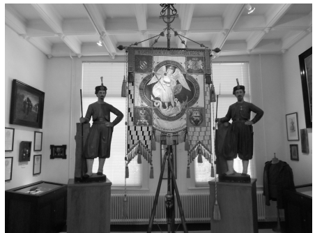
Impressie van het Nederlands Zouavenmuseum in Oudenbosch.

Later zijn er diverse verenigingen opgericht van oud-zouaven. In 1892, 25 jaar na het einde, kregen allen nog een medaille uitgereikt.