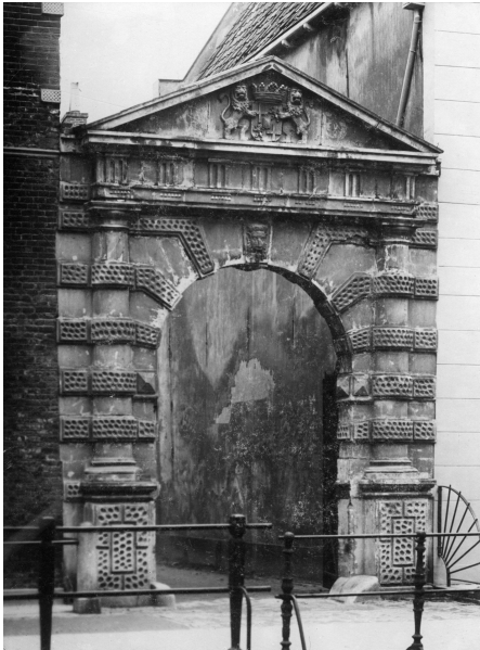
Utrecht, Hofpoort aan de Nieuwegracht, 1903