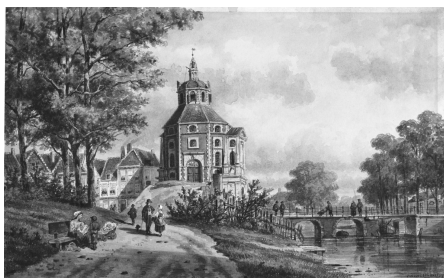
Utrecht, singelplantsoen, Wittevrouwenpoort en -brug, 1858