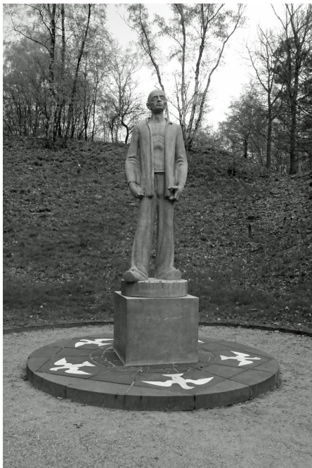
De Stenen Man.

Hierna kreeg het kamp nog diverse functies zoals bewarings- en verblijfkamp (interneringskamp) voor o.a. foute Nederlanders, daarna een militair complex genaamd Kamp Laan 1914, een mobilisatiecentrum de Boskamp genaamd, een opvang voor Molukkers, voormalige KNIL-militairen en een politeschool.