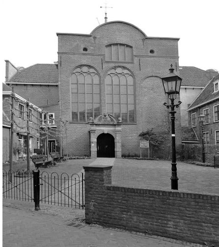
De Hervormde Kerk van Blokzijl.