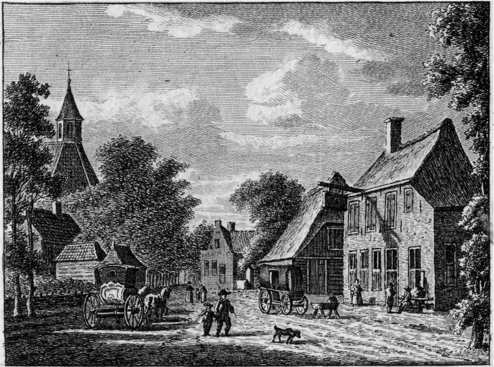
T' DORP DRIEBERGEN.

Driebergen, 1740-1760, Coll. HUA, cat. nr. 200517.