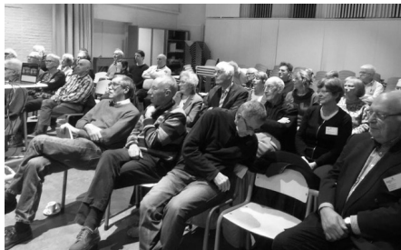
De aanwezigen luisterden geboeid.

Voor vragen, tips of suggesties kun je mailen naar hallo@digitalevoorzorg.nl of direct met Sander van der Meer bellen op: 06-34006699.