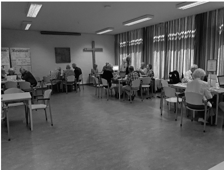
Overzicht van de zaal tijdens de computermiddag.