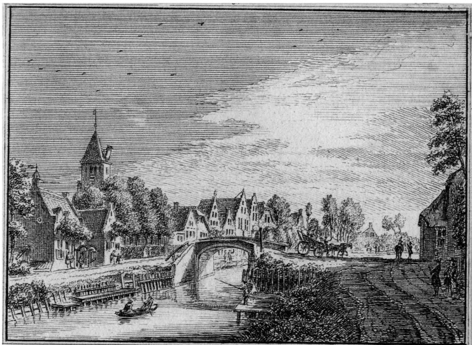
Het DORP MEEREN.

De Meern, 1744, Coll. HUA, cat. nr. 200740