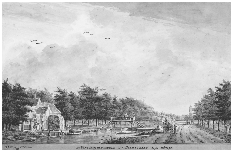
Vingerhoedfabriek aan de Biltse Grift, 1755–1765