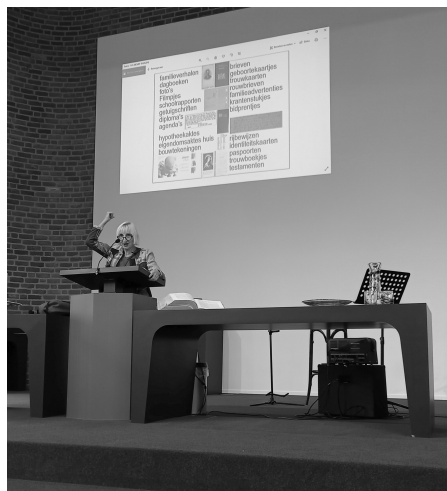
Antonia tijdens de lezing

aankleding van uw stamboom met hoe de voorouders leefden, woonden, werkten en waar deze informatie gevonden kan worden.