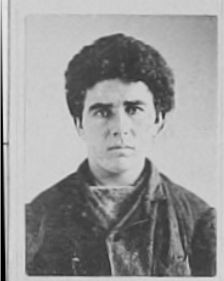
Lense Wijshake, januari 1908.

Over de vader van mijn moeder, geboren op 3 januari 1885 in Uffelte, waren er binnen de familie wel wat geruchten dat opa vroeger wel eens veroordeeld was. Waarvoor precies dat wisten ze eigenlijk niet.