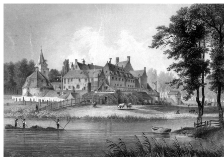
Kasteel van Woerden 1851, van 1830 tot 1860 strafgevangenis voor mannen. Collectie RHC Rijnstreek en Lopikerwaard, fotonr. P0072-A

Hof van Assisen 's-Gravenhage 22-7-1833: geseling, brandmerk met de strop en 8 jaar gevangenis Woerden. Die straffen waren niet mis; het zal niet om het stelen van een brood zijn gegaan.