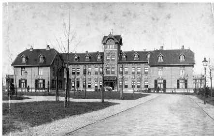
Het gebouw van het Rijksopvoedingsgesticht 'Op de Berg' aan de Utrechtseweg 247 te Amersfoort. De foto dateert uit de periode 1910–1935, de fotograaf en de rechthebbende zijn onbekend.

In Amersfoort was tussen 1910 en 1967 het Rijksopvoedingsgesticht voor jongens gevestigd, waar buitengewoon aangelegde jongens uitgebreid lager onderwijs kregen. Die jongens waren veroordeeld voor straf- bare feiten, die ze gepleegd hadden. 20