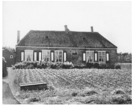
De hofstede Molenhof aan de Noordweg voor de afbraak in 1965. De foto is genomen omstreeks 1950.