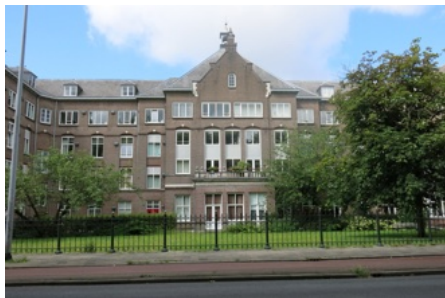
Deel van het voormalige academische ziekenhuis aan de Catharijnesingel te Utrecht

mensen bij mij in de straat waar ze wonen maar de namen van hun ouders niet. Hoe kan het dat die namen bekend waren?