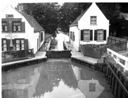
Links: Stadsdam te De Meern 1775–1785, cat. nr. 107533/coll. HUA; rechts: Stadsdam te De Meern ca 1920, cat. nr. 89475/coll. HUA