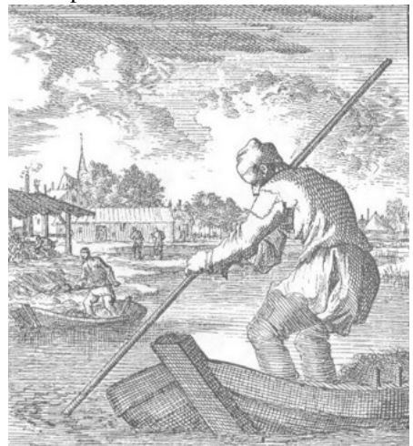
Veenman.