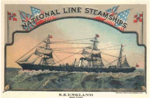
De SS Engeland

De passagiers vanuit Liverpool waren meest Duitsers. Op 29 maart 1866 vertrok de SS Engeland naar New York met 1202 tussen-dekspassagiers, 16 cabinepassagiers en 122 bemanningsleden. De kapitein was R.W. Grace. Het schip was zelfs voor de ruime begrippen van toentertijd overvol en dat was onverantwoord. Op Goede Vrijdag, Zaterdag en Paaszondag stond er een geweldige storm en alle passagiers zaten dus op elkaar gepropt wat het hierna volgende probleem misschien verergerd heeft.