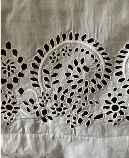
Detail van de dooptjurk. De hele dooptjurk staat afgebeeld op de voorpagina van dit nummer.

Jelle Kaastra vertelt over een 135 jaar oude dooptjurk in de familie.