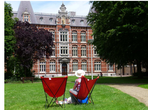
Familiemuseum in Eijsden

Inmiddels is voor mij, en naar ik hoop ook voor u, de zomervakantie weer achter de rug. Elk jaar kan ik het niet laten om tijdens de zomervakantie iets aan mijn hobby te doen. Heeft u dat ook? Dit keer bestond dat iets uit een bezoek aan het pas geopende Familiemuseum in Eijsden. Dit museum lag namelijk op onze route naar een camping in Luxemburg.