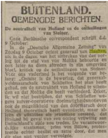
7. De Tijd van 12 oktober 1921

neutraliteit van Holland in den komende oorlog met Frankrijk onder alle omstandigheden zou respecteren.