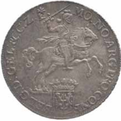
Afbeelding. Gelderse zilveren ducaton

de Cop, de gerichtskamer in gelopen. Vervolgens viel De Kemper haar aan en sloeg haar met een fles op een arm en wel zodanig 'dat het bloet daer tapelings uijt quam loopen.' Volgens één van de aanwezigen had zij een groot gat in haar arm.