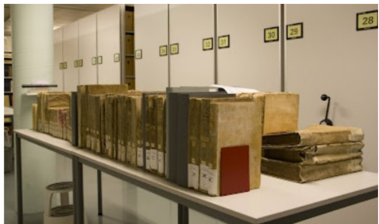
228 banden, 50.000 bladzijden vrijwillige rechtspraak