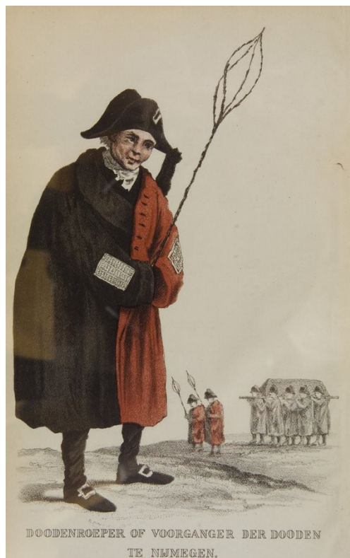
DOODENROEPER OF VOORGANGER DER DOODEN TE NIJMEGEN.

De link vind je onderaan de nieuwsbrief.