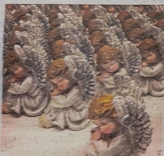
Babymoord door ouders kwam vaak voor.