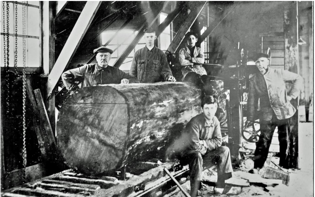
De houtzagerij in Lunteren.