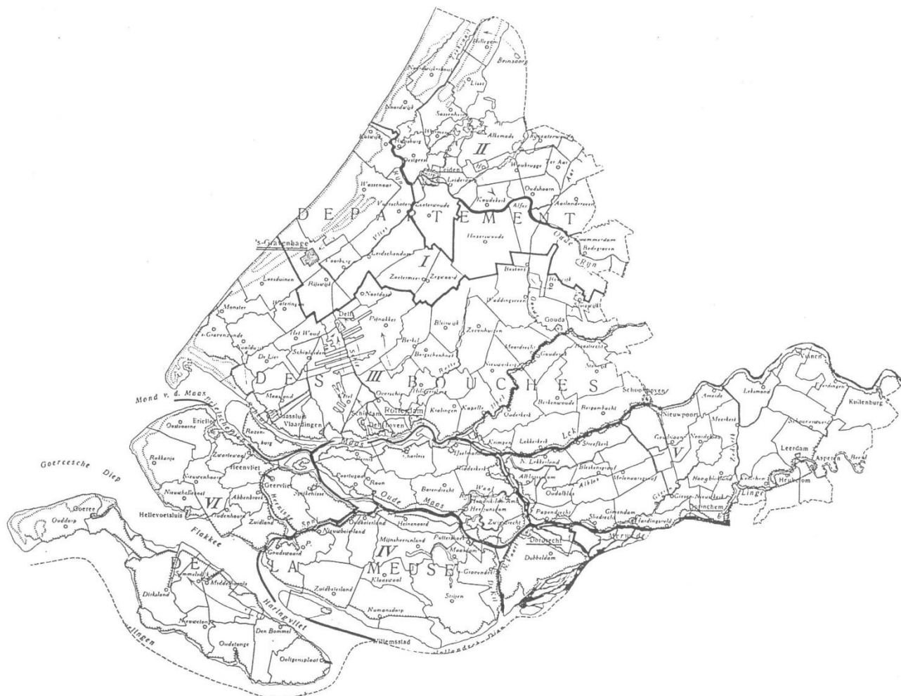
Département des Bouches-de-la-Meuse Behoort bij de reacties op vraag 67 (Kaart: Nationaal Archief, Den Haag: NL-HaNA_3_02_09_Departement-Monden-van-de-Maas)