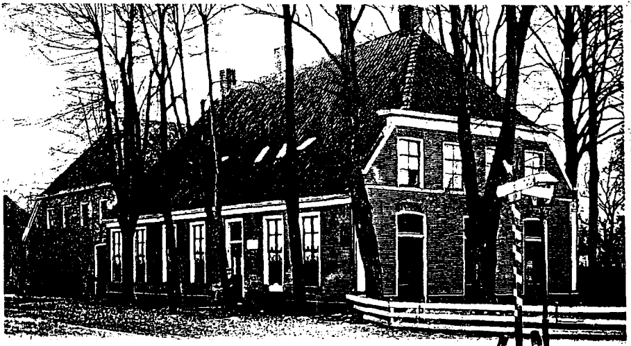
DALEN, — Hotel van Tarel.