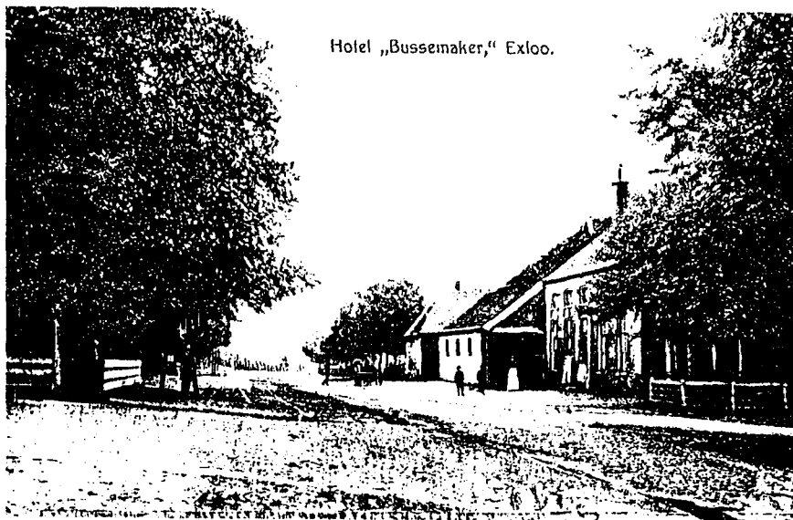
De Hoofdstraat in Exloo met rechts Hotel Bussemaker tevens gemeentehuis.

Beide keren ging het gemeente-archief verloren: vandaar dat het verleden van de gemeente nogal duister is. De meest tragische brand woedde op 21 mei 1917 bij Valthermond. Bij deze veenbrand verloren 19 mensen het leven en werden 109 woningen verwoest.