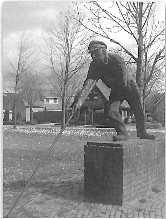
1) Standbeeld 'De Turfschipper'. Onhuld op 20 sept. 1991 door dhr. Vuursteen, burgemeester van Zuidwolde. Het beeld is gemaakt door beeldhouwer Bert Kiewiet en staat te Drogteropslagen. (Red.)