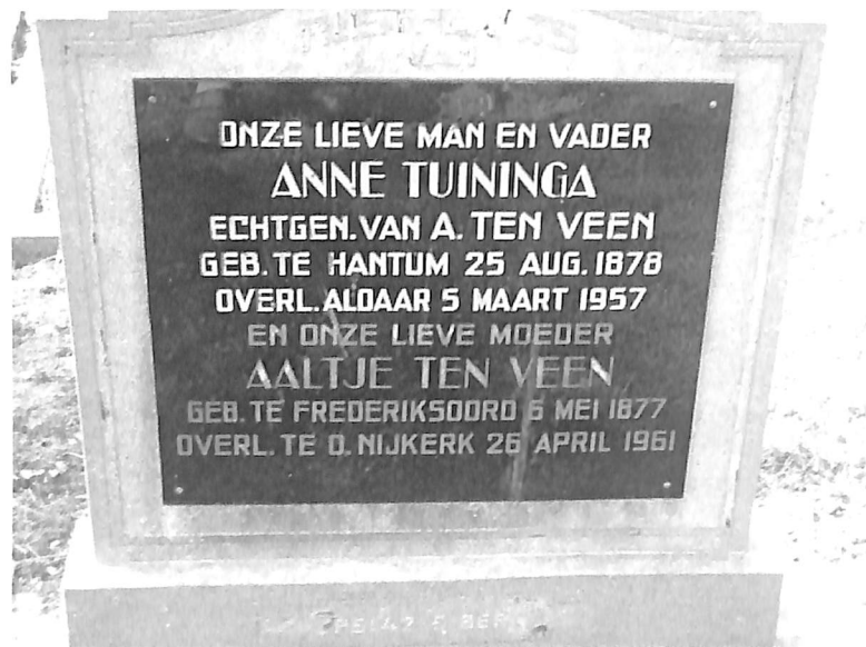
Graf van Anne Tuininga en Aaltje Ten Veen. (Red.)