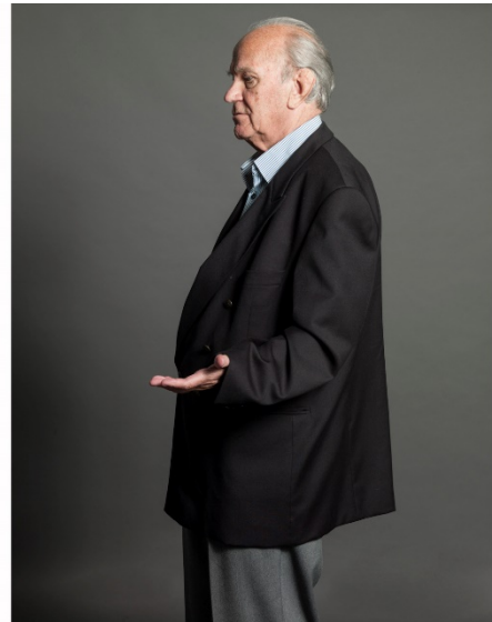
Frans de Gooijer

Vele jaren (1993 tot 2015) was Frans bestuurslid van Stichting Stad en Lande van Gooiland en begiftigd met de Emil Ludenpenning (2014).