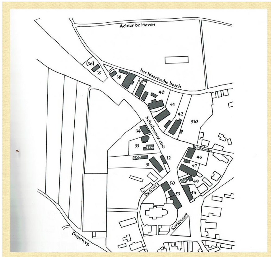
Kaart op basis 1st kadastrale opmeting van 1824