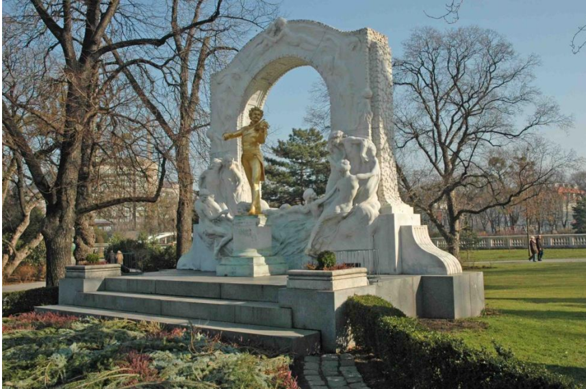
Gedenkmonument Johann Strauss, Edmund v Hellmer