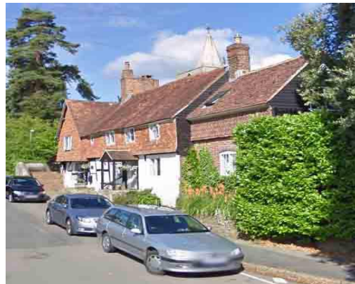
Huidige situatie Church Lane, Witley