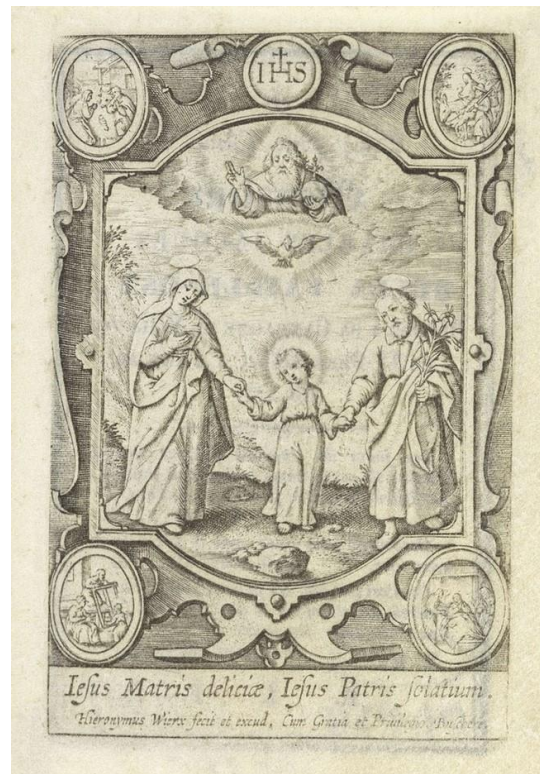
1563, Aardse en hemelse Drie-eenheid, Hieronymus Wierix

[RT: Aan deze lijst dient wel de verzameling van de NGV toegevoegd te worden!]