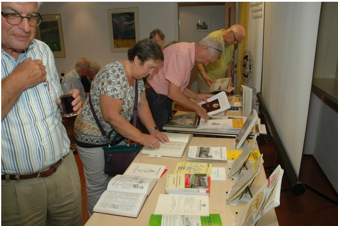
Snuffelen in de boeken

Na de pauze ging Jos nog in op de verschillende vragen die hem vooraf per e-mail werden gesteld.