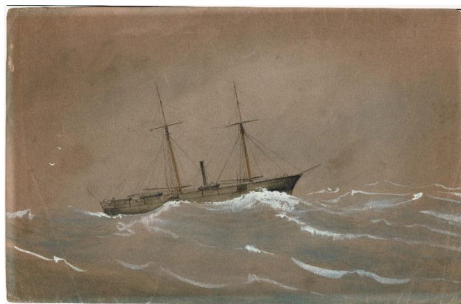
U.S.S. Norseman, Southampton/Johannesburg, 15 okt. 1872, vervaardigd Maria Cates, kwartiernr. 15