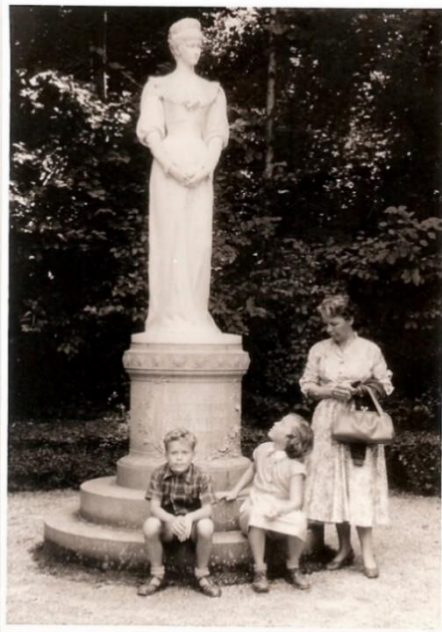
Keizerin Elisabeth Monument, vervaardigd Edmund Karl Hellmer 1901, kwartiernr. 12

De redenen voor hun verhuizingen waren zeer divers, variërend van lokale hongersnood, politieke instabiliteit, economische en politieke vluchtelingen en godsdienstconflicten, tot interesse in andere culturen en blikverruiming. In vogelvlucht werden de meest markante gebeurtenissen in het leven van die (voor)ouders en hun beroepen nader besproken en in het tijdsbeeld geplaatst, inclusief de ontwrichtende gebeurtenissen van WO I en WO II. Betrokkenheid bij het socialisme (initieel gebaseerd op Marxisme) en de op opkomst van de vrouwenbeweging en –emancipatie speelden een grote rol. Ook de beroepen van de voorouders waren heel divers, zoals journalist/publicist, boeken- en krantendrukker, beeldhouwer, schoolleer/lekenpriester, jurist, psychoanalyticus (bij Sigmund Freud), onderwijsadviseur, vrouwenrechten activiste, medicus en leider farmaceutisch bedrijf. In de presentatie werd ook speciale aandacht gegeven aan problemen bij het vaststellen van de genealogische gegevens, zoals praktisch onbegonnen werk bij zoveel emigraties, het ontbreken van geboorteregistratie, de verwisseling van registratiedocumenten in verband met niet-Joodverklaring, geheimhouding van de naam van de vader van een onecht kind (met link naar Habsburgers) en complicaties bij de naamgeving van Joden. Kortom, een boeiende reis door tijd en ruimte en eigenlijk “niets nieuws onder de zon: migratie is van alle tijden”.