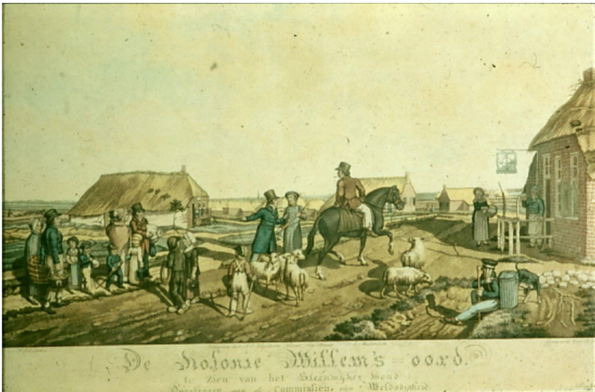
De Kolonie Willem's -oord. te Zien van het Steenduyker Meud Dinsdag 1844. Commisarien, van Weldadigheid Vrije kolonie Gezicht op Willemsoord

Wil vertelt met veel anekdotes over de belevenissen van die kolonisten in nieuwe nederzettingen als Frederiksoord, Willemsoord en Wilhelminaoord en later de Ommerschans en Veenhuizen. Over weeskinderen, die een deel van hun jeugd daar doorbrengen, over kolonisten, die in conflict komen met de strenge koloniale discipline rond zedelijkheid, werkzaamheid en properheid. En over geslachten die daar werkelijk 'allengens worden opgebeurd uit de zedelijke verbastering', waar zij door hun armoede in terecht gekomen zijn en die later succesvolle nazaten, tot aan een Tweede Kamervoorzitter toe, zullen voortbrengen.