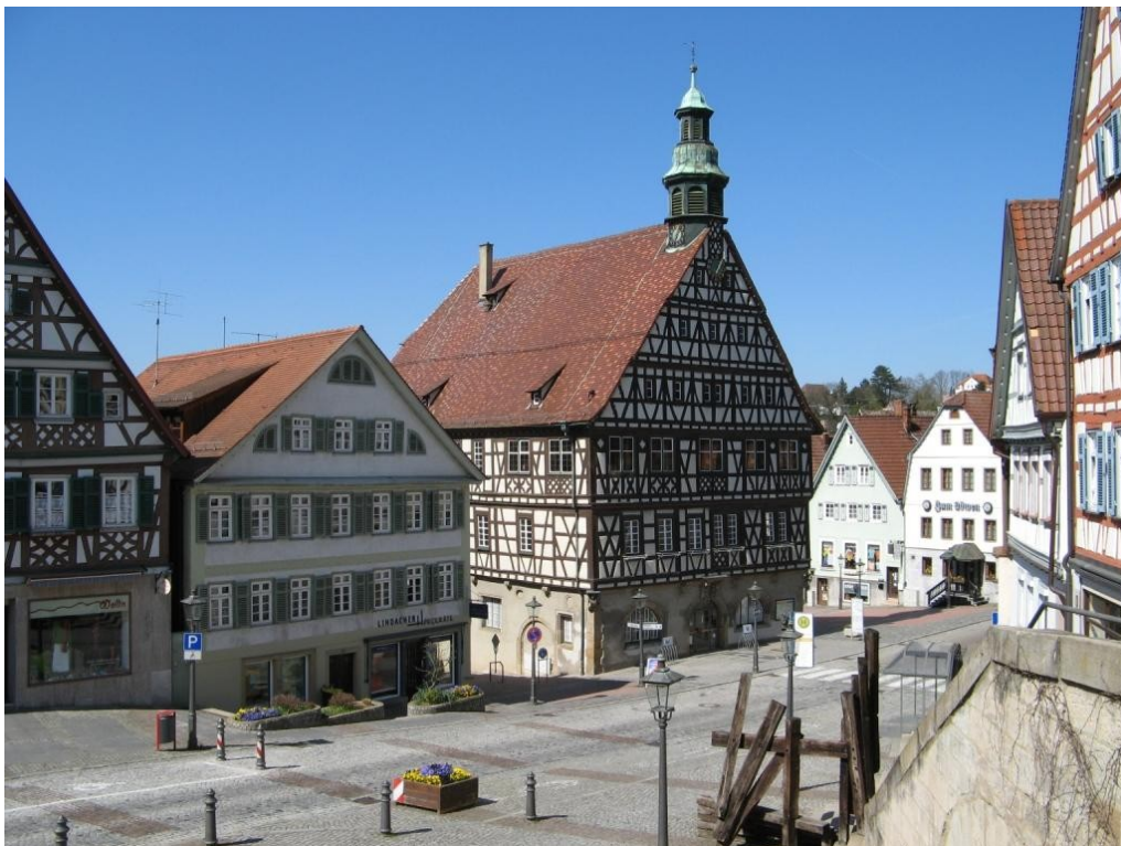
Backnang, Baden-Württemberg