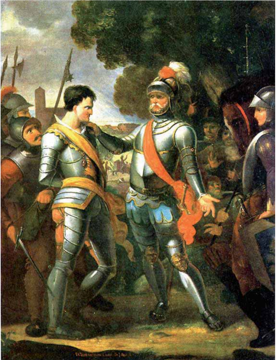
Ocko II tom Brok wordt gevangen voorgeleid aan Focko Ukena na de Slag op de Wilde Ackers in 1427 (Tjarko Meyer Cramer, 1803).