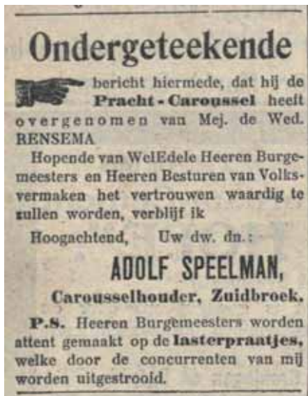
Nieuwsblad van het Noorden 12 januari 1911