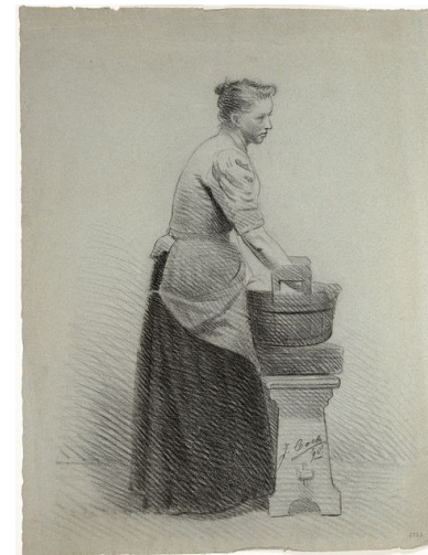
Een vrouw die de was doet, getekend in 1898 door J. Cock.