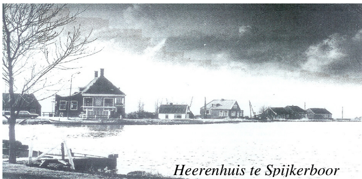
Heerenhuis te Spijkerboor