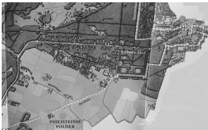
Op een wandelkaart van 2006 is de Roossloot nog gemakkelijk te vinden. Hij vormt de scheiding tussen de Philisteinse en de Damlander polder.

Hij woont op de Roossloot in Bergen en timmert behoorlijk aan de weg. In het Oud Rechterlijk Archief van Bergen komen we hem talloze keren tegen i.v.m. betaling van huur en achterstallig arbeidsloon, het planten van helm, geroofd hout uit een boelhuis en gestolen wagenhout uit het duin.