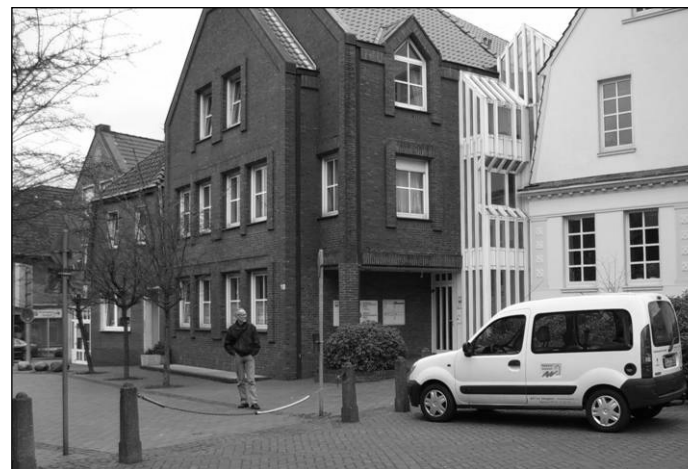
De ingang van het archief in Meppen