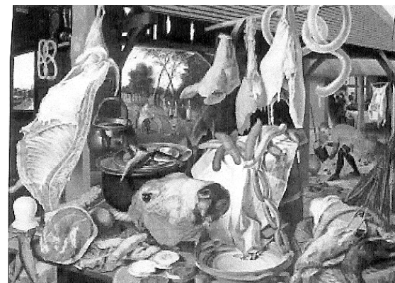
Pieter Aertsen (1509-1575)