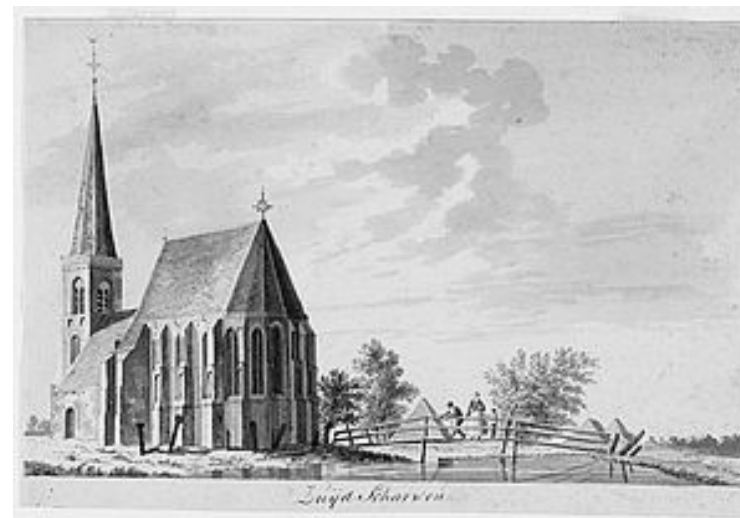
Zuid-Scharwoude anno 1787, getekend door Tavenier.