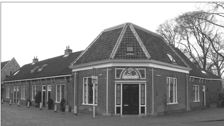
Het Geesterbofje te Alkmaar anno 2008

Dit afgelopen zijnde hebben wij hiervan opgemaakt dit Proces Verbaal hetwelke de getuigen met ons Griffier hebben geteekend. L. IJ Besten, Willem Rensen en J.A. Kluppel