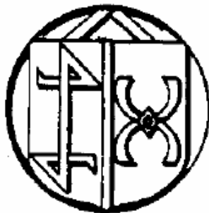
handmerken op een grafsteen in de St. Janskathedraal 's Hertogenbosch