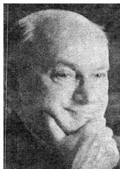
Joost Abraham Maurits Meerloo