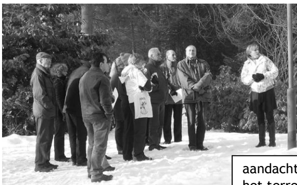
aandacht voor de rondleiding op het terrein bij de Runxputte