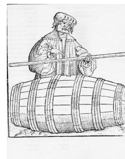
Een wijnroeder uit 1531