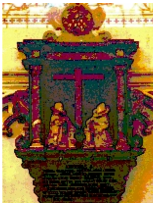
Epitaaf van Angela Creeft en Jacob van Balen in de St. Jan in 's-Hertogenbosch.

Dit wapenbord werd op last van de kerkenraad van de St. Jan in 1640 verwijderd. Bron: Taxandria, 1895, bl. 332 en 1905, bl. 60,61 en 312.