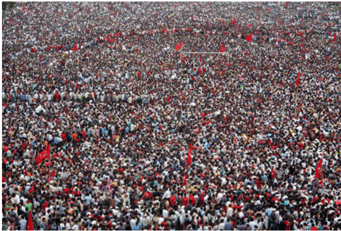
De mensheid uitgroeit tot een plaag voor de aarde

Halverwege, aan het einde van de vorige eeuw (in 1908 bv), is van de overledenen nog meer dan de helft een kind onder de 12 jaar. De laatste generatie van deze overgangperiode, de generatie van de geboortegolf, is nu van middelbare leeftijd -dwz de jongsten ervan bijna en de oudsten net niet meer-; de vergroening is dus voorbij en de vergrijzing komt eraan. Zelf ben ik een van 9 kinderen; maar het aantal kleinkinderen is niet 81, maar 18 (nou vooruit dan: 20). Met mijn generatie als ouder is de transitie in Nederland dus voltooid. In parentelen en genealogieën zien we deze periode terug, doordat het merendeel gevuld wordt met de 19 de - en 20 ste - eeuwse vertakkingen van de familiestamboom.