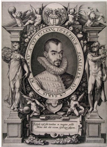
Josephus Justus Scaliger

Hardouin is de auteur van verschillende boeken over filologie, theologie, geschiedenis, archeologie, numismatiek, chronologie en de filosofie van de geschiedenis. Helaas bleven zijn werken voor de meeste mensen onbekend, omdat ze grotendeels in het Latijn waren geschreven. Hij toonde aan dat bijna de gehele klassieke literatuur niet eerder dan de dertiende eeuw door kloosterlingen was geschreven. Over een paar auteurs, o.a. Cicero, Horatius en Plinius de Oudere, had hij zijn twijfels. Hij beweerde zelfs dat Christus en zijn