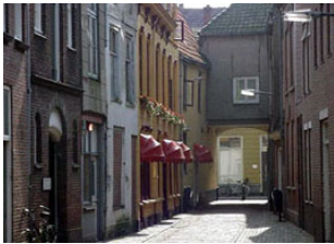
Afb. 3: Schilderstraat

Niet met overweldigend succes want hij overleed ( Schilderstraat, wijk D nr 10 [10])