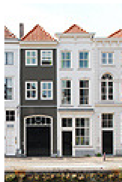
Afb. 4: Brede Haven.