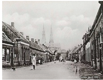
Afb. 2: Grote Berg Eindhoven.