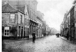
Afb. 8: Vughterdijk