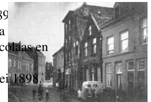
Afb. 6: Weversplaats