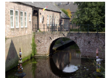
Afb. 7: Zusters van Orthenpoort