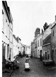
Afb. 5: Lange Tolbrugstraat