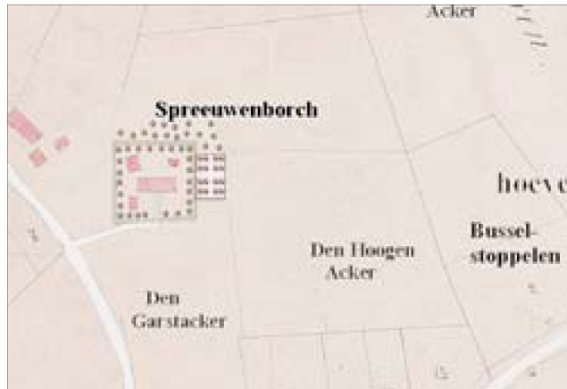
Afbeelding 2 Kaart van Kerkhoven rond 1636 (reconstructie). De Nieuwe Baan tussen Helvoirt en Tilburg, aangelegd in de jaren 1806-1807 over de Kreiteheide, is omwille van de orientatie nog afgebeeld.