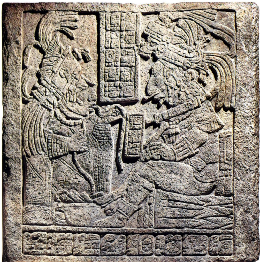
Aderlating als een rituele handeling bij de geboorte van de erfopvolger van een Maya-vorst (ca 770 na Chr). Londen, Brits Museum