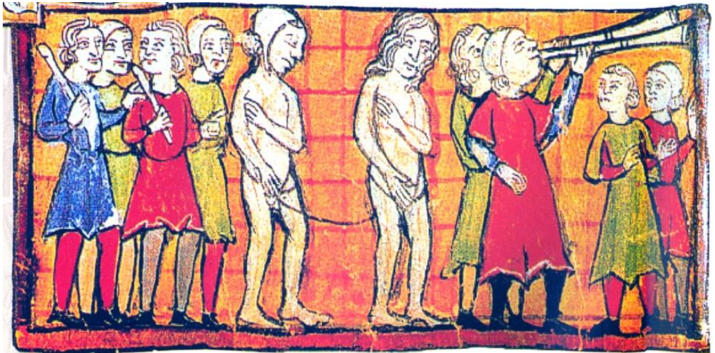
Volksgerecht wegens overspel, middeleeuwse miniatuur