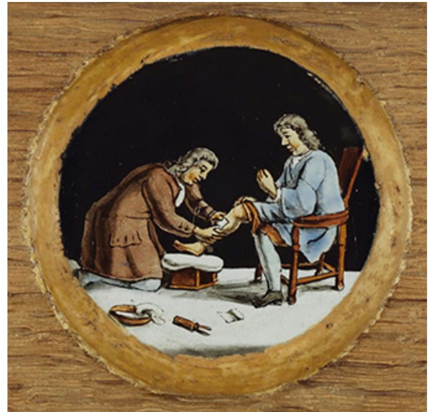
Een chirurgijn behandelt een beenwond (Rijksmuseum)