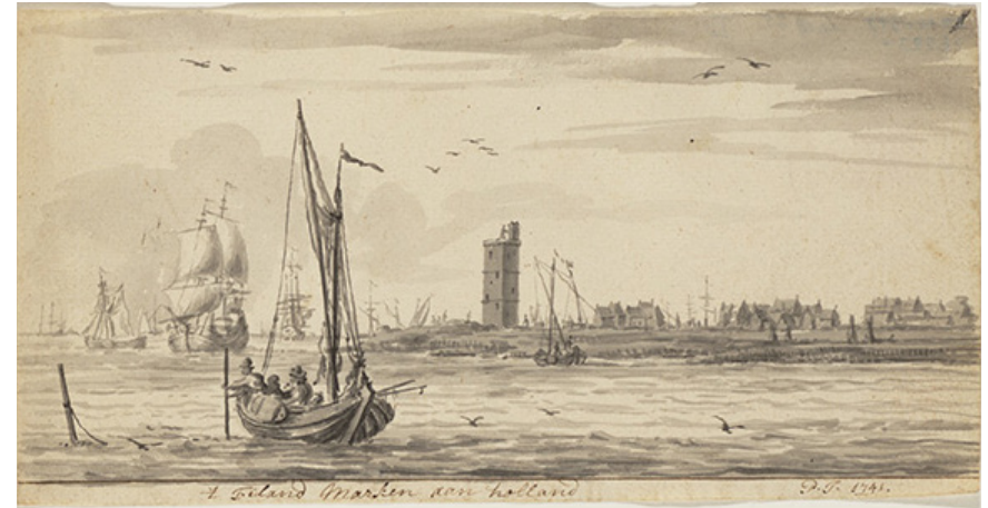
Gezicht op het eiland Marken anno 1741. (Zuiderzeemuseum)

gebleven' is. Amper 19 jaar oud eindigde zijn leven in de Finse Golf. Een zoektocht naar de naam Claas Bonefaas in Alkmaarse doop-, trouw- en begraafboeken van na 1715 levert dan ook geen resultaten op.