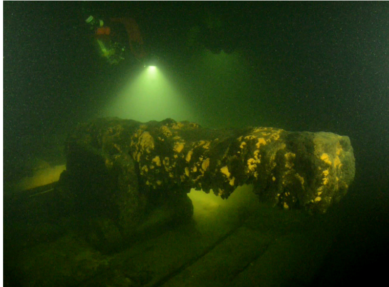
Een kanon van de Huis te Warmelo op de bodem van de Finse Golf. (SubZone)