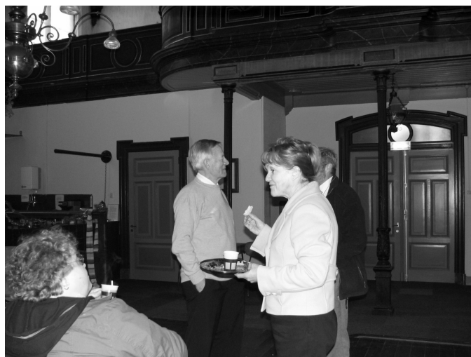
Impressie Nieuwjaarsreceptie in de Berkhouter Kerk

Verder hopen wij met u op een vruchtbaar verenigingsjaar en een goede voorbereiding op ons 25-jarig jubileum, in mei 2009.