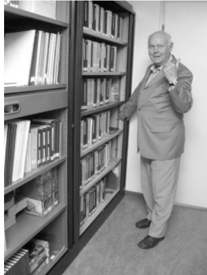
de nieuwe kasten

Een kop koffie met bijna altijd wat lekkers erbij voor een eurootje en `volop praat`. Er is heel veel kennis bij de leden van de werkgroep om u vastgelopen onderzoek weer een nieuwe impuls te geven. We hebben het knipselarchief met duizenden advertenties gesorteerd op naam. Mappen vol met streekberichten uit de krant van de laatste vijf jaar, ook allemaal gesorteerd op naam. Bestanden op de computer. Genealogische bronnen op CD enz. enz. En vind je 'n keer niks dan heb je evengoed een prachtige en vooral gezellige ochtend of middag. Dus tot binnenkort in het Nivon gebouw. We zijn iedere eerste zaterdag van de maand open van elf tot twee uur behalve in februari en in de vakantiemaanden juli en augustus.