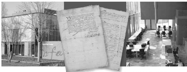
Het oudste aandeel ter wereld, uit 1606, ontdekt in 2010.

Piet Has Automobielen Lageweg 25, 1628 JS Hoorn telefoon 0229 215416 info@piethas.nl