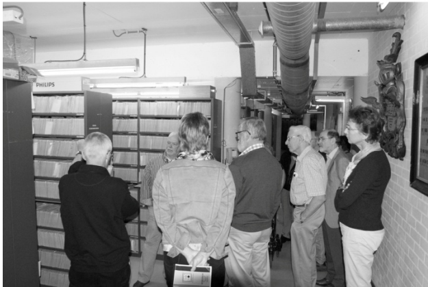
Uitleg bij de Persoonskaarten

Na deze uiteenzetting werd er iets gegeten. Daarna volgde een rondleiding door de archiefruimte van het CBG. Allereerst kregen we uitleg over de persoonskaarten. Het CBG bewaart ongeveer 2 miljoen persoonskaarten. Kopieën hiervan kunnen opgevraagd worden. Na de persoonskaarten werden we langs stellingen vol boeken met genealogieën geleid. Ook is er een massa familieberichten. Deze worden door een groot aantal mensen in het land uitgeknipt en opgestuurd naar het CBG. Daar worden ze nagenoeg volledig automatisch gescand en geïndexeerd.