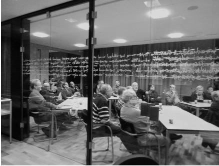
Aandachtig gehoor in de nieuwe zaal