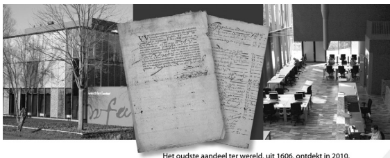
Het oudste aandeel ter wereld, uit 1606, ontdekt in 2010.

Piet Has Automobielen Lageweg 25, 1628 JS Hoorn telefoon 0229 215416 info@piethas.nl