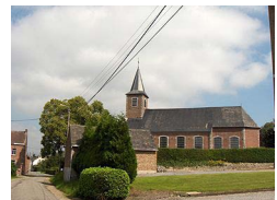
De kerk van Bertrée (B)