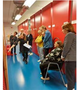
Rondleiding in WFA voor vrijwilligers

Wilt u de reizende tentoonstelling ook zien? Of heeft u interesse in de andere activiteiten? Kijk dan op de activiteitenpagina www.wfa.nl/opstand .