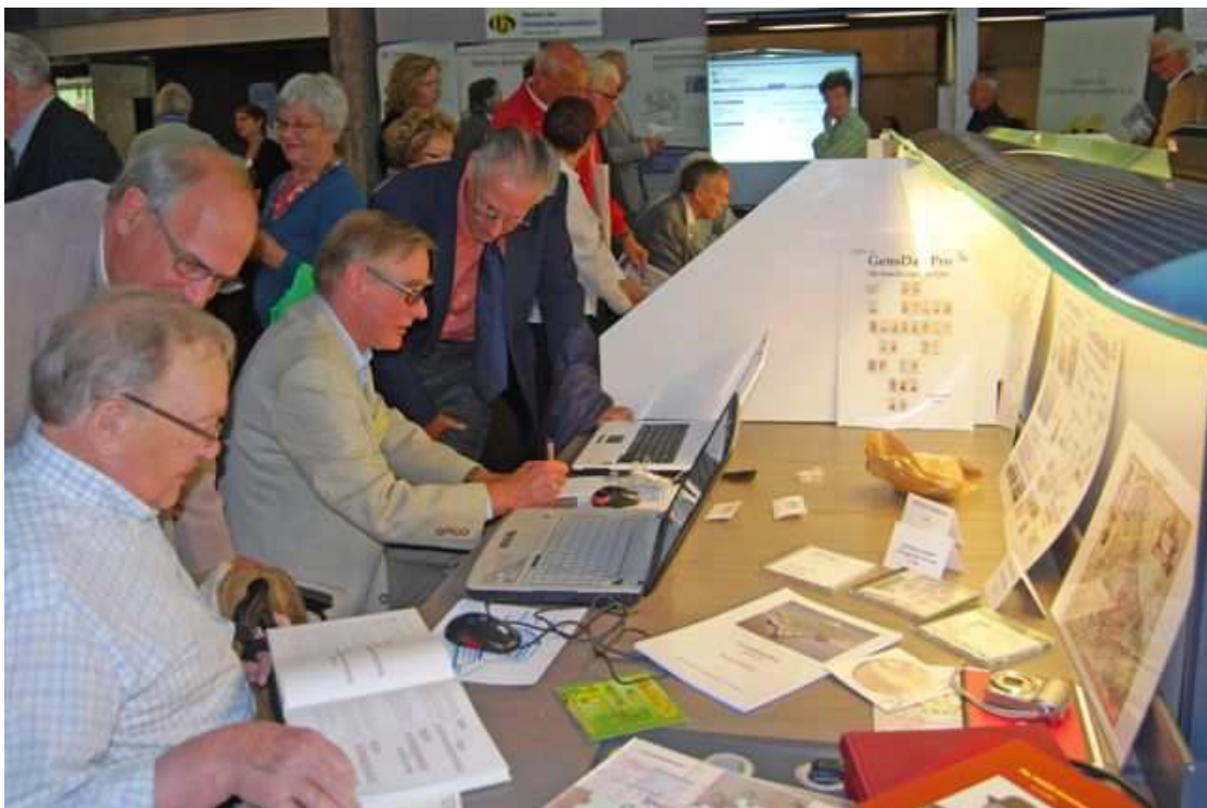
De NGV-groep GensDataPro tijdens het Famillement september 2012 in Maastricht