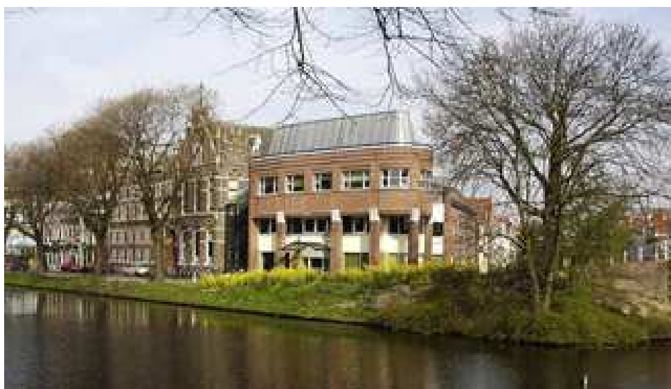
Het archief aan de Boisotkade te Leiden

Van de rondvraag wordt geen gebruik gemaakt. Onder dankzegging aan de leden sluit de voorzitter om 19.55 uur de vergadering.