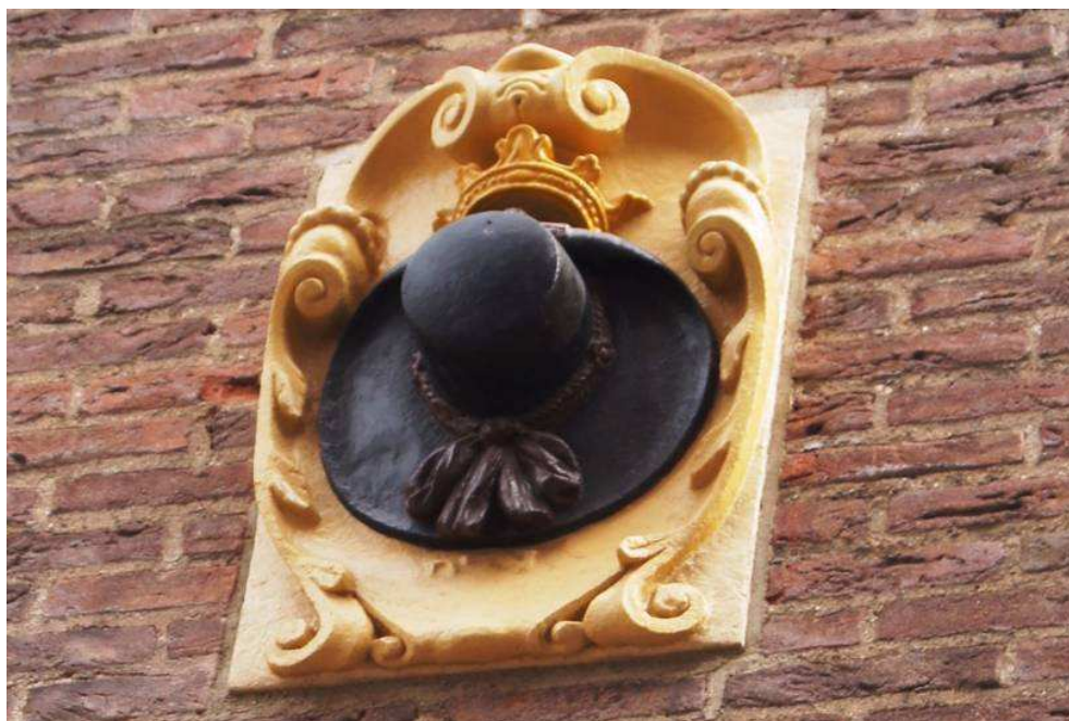
De Gecroonde Hoet

De landelijke Nederlandse Genealogische Vereniging (NGV) kent verschillende regionale afdelingen. Voor onze afdeling RIJNLAND gelden de postcodes: 2170-2179 (Sassenheim, Lisse), 2200-2259 (Katwijk, Noordwijk, Rijnsburg, Valkenburg, Voorhout, Voorschoten, Wassenaar), 2300-2399 (Leiden, Oegstgeest, Leiderdorp, Warmond, Roelofarendsveen, Zoeterwoude, Hazerswoude), 2400-2439 (Alphen a/d Rijn, Bodegraven, Nieuwkoop), 2442-2489 (Ter Aar, Aarlanderveen, Zwammerdam), 2500-2529 ('s Gravenhage Centrum, Laakkwartier), 2560-2599 ('s Gravenhage Segbroek, Zuiderpark, Scheveningen, Haagse Hout annex Mariahoeve), 2730-2739 (Benthuizen). Het lidmaatschap van de NGV is € 39.- per jaar, (€38.- bij incasso). Aanmelden en wijzigingen doorgeven kan uitsluitend bij de landelijke (centrale) ledenadministratie: Ledenadministratie NGV, Postbus 26, 1380 AA Weesp. Naast het lidmaatschap van onze afdeling kan men zich aanmelden voor een lidmaatschap van andere afdeling; dit kost € 9.- per jaar per afdeling. Zie voor nadere informatie op de website van de NGV: www.ngv.nl