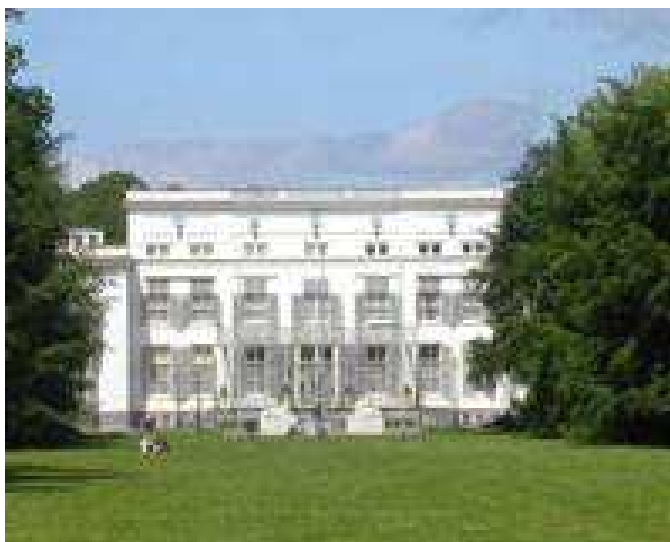
Raadhuis De Pauw in Wassenaar

De archieven van Voorschoten zijn vanaf 27 mei 2013 raadpleegbaar in het gemeentearchief van Wassenaar, Raadhuis De Pauw, Raadhuislaan 22, 2242 CP Wassenaar.