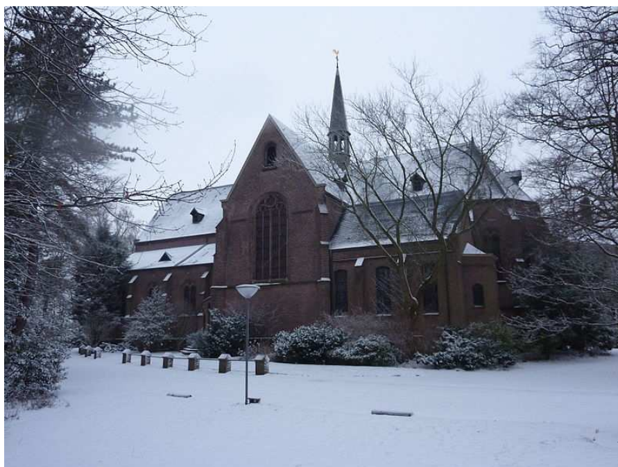
Warmond - St. Matthias kerk